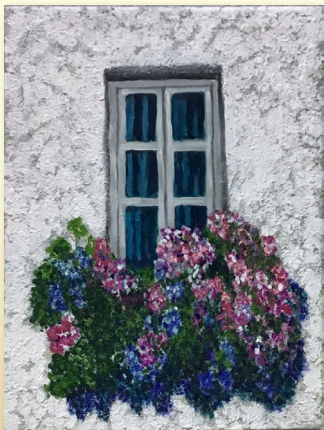
Matilde Pontón Montalvo Hay salida