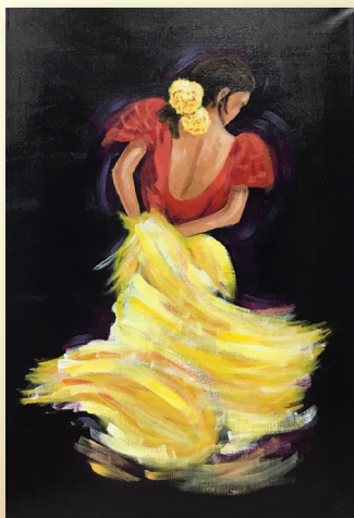
Matilde Pontón Montalvo Revolera