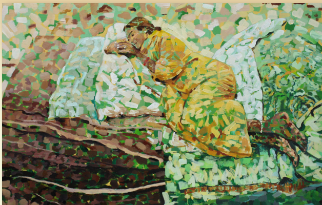
Margarita Navas Camba Bombai